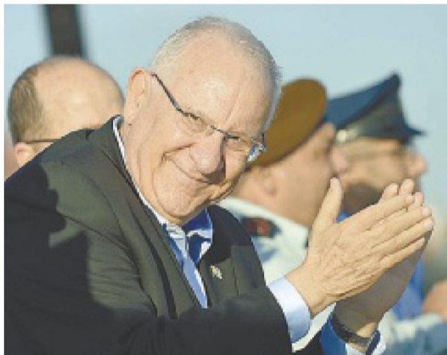
ראובן ריבלין. "איני יכול להציע פתרונות"

"יש מקומות שבהם היו מלחמות שקשה לדמיין. מספיק להיזכר באלימות בבוסניה, בסרביה ובקרוואטיה ולראות את שיתופי הפעולה שיש שם כעת בין קבוצות שלא היו יכולות להסתכל אחת על השנייה"